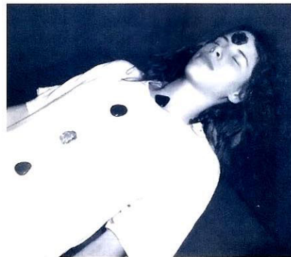
Séance d'équilibrage énergétique et de reconnexion à l'enfant intérieur

Lorsque nous nous adressons à un chaman, un guérisseur ou un magnétiseur, nous sommes obligés de mettre de côté les croyances limitatives du mental et de sa logique cartésienne. Ceci nous permet de nous ouvrir à la dimension cosmique, divine et spirituelle de l'existence dont nous ignorons la logique et donc à laquelle nous ne pouvons pas raisonnablement fixer de limite. Comme la seule limite est celle que nous nous imposons, il est évident que tant que l'on